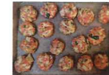
すみれ ハンバーグ