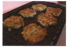
ちゅうりっぷ お好み焼き